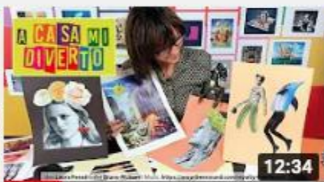
A casa con Zizi - Collage fotografico