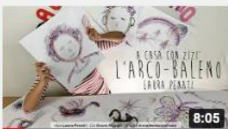
A casa con Zizi - Arcobaleno... in un...