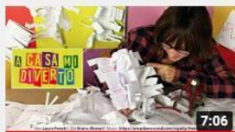
A casa con Zizi - Libro Bianco senza parole