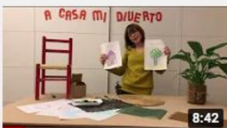
A casa con Zizi - Sfrega e colora