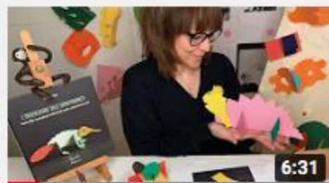
A casa con Zizi - Taglio Incastro Creo