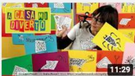
A casa con Zizi - Strappa e Crea