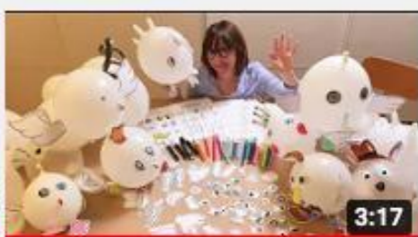
A casa con Zizi - gonfiAnimali