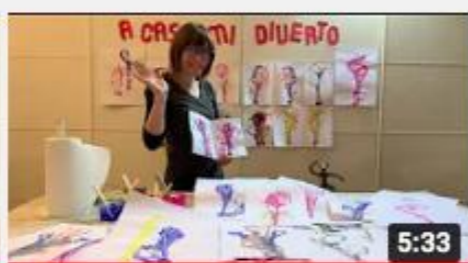
A casa con Zizi - Un filo di colore.