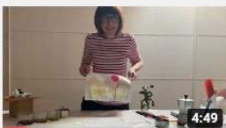
A casa con Zizi color barbabetola