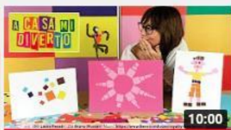
A casa con Zizi - Mosaico