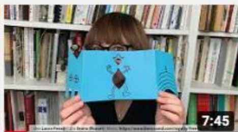
A casa con Zizi - Libro a soffietto