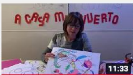
A casa con Zizi - Scarabocchiando.....