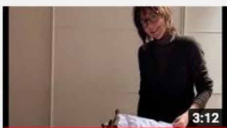
A casa con Zizi il lettino

Lien vers la série Youtube sur la chaîne de Laura Penati