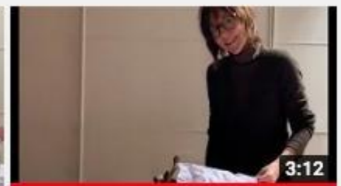
A casa con Zizi il lettino