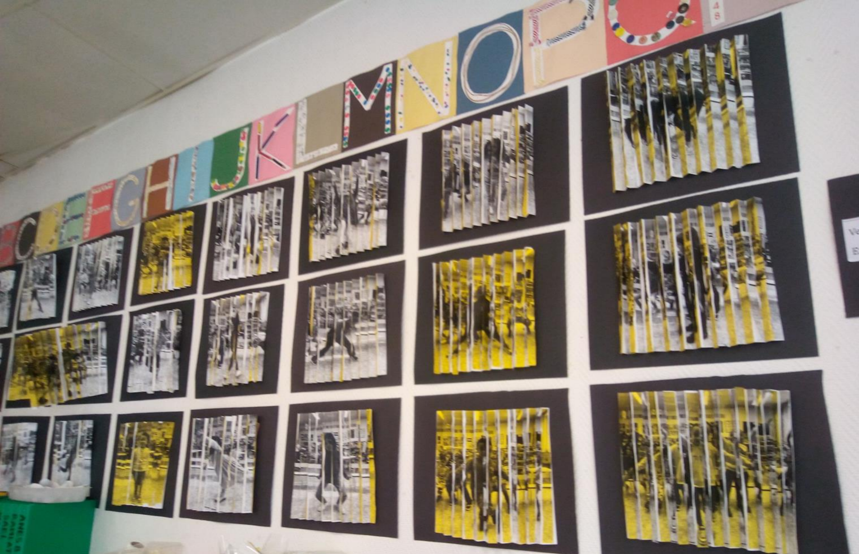
Immagini "magiche" realizzate dai bambini della scuola dell'infanzia dopo aver lavorato con la ludobox "L'amulette du climat" #7