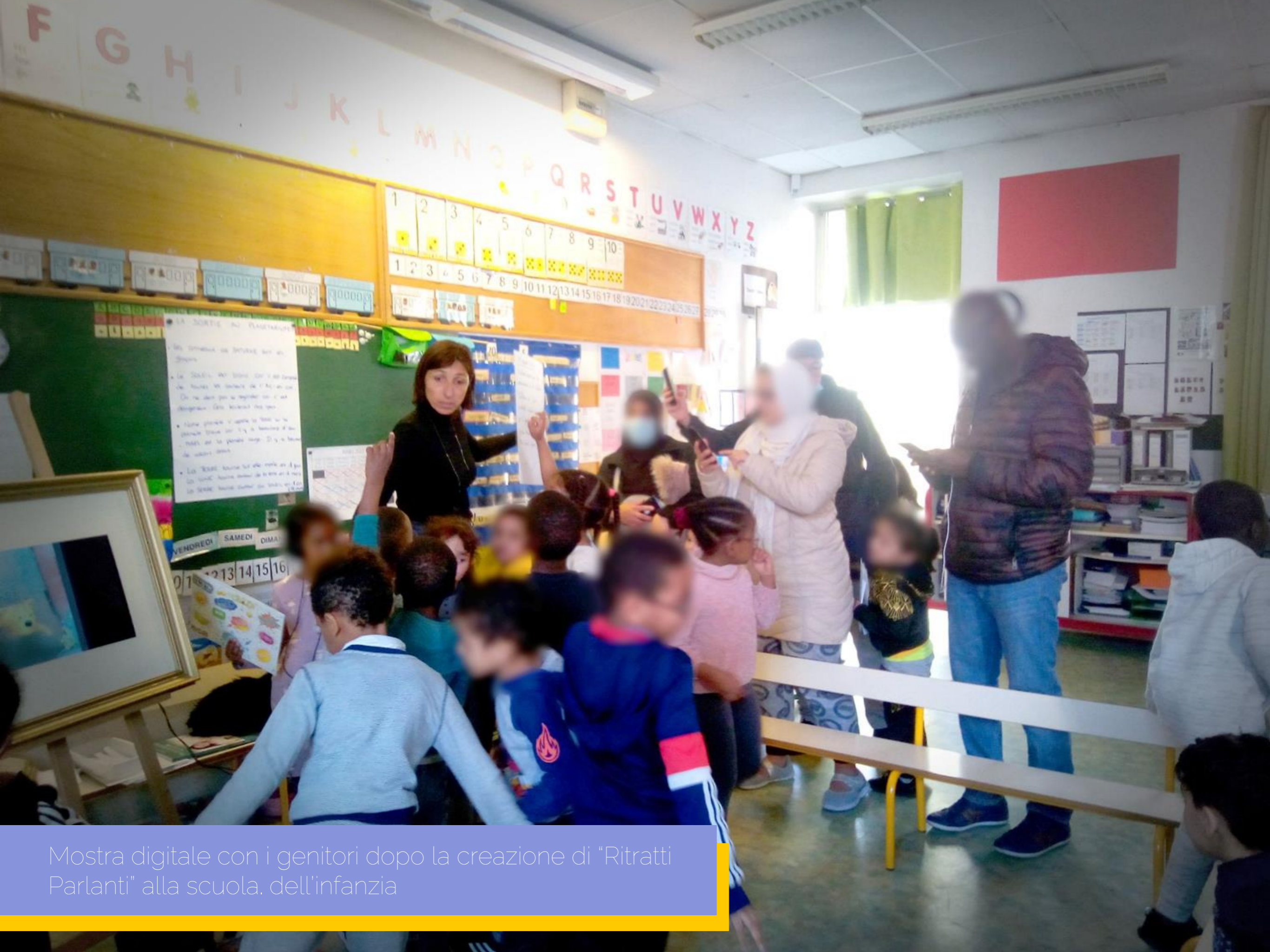
Mostra digitale con i genitori dopo la creazione di "Ritratti Parlanti" alla scuola dell'infanzia