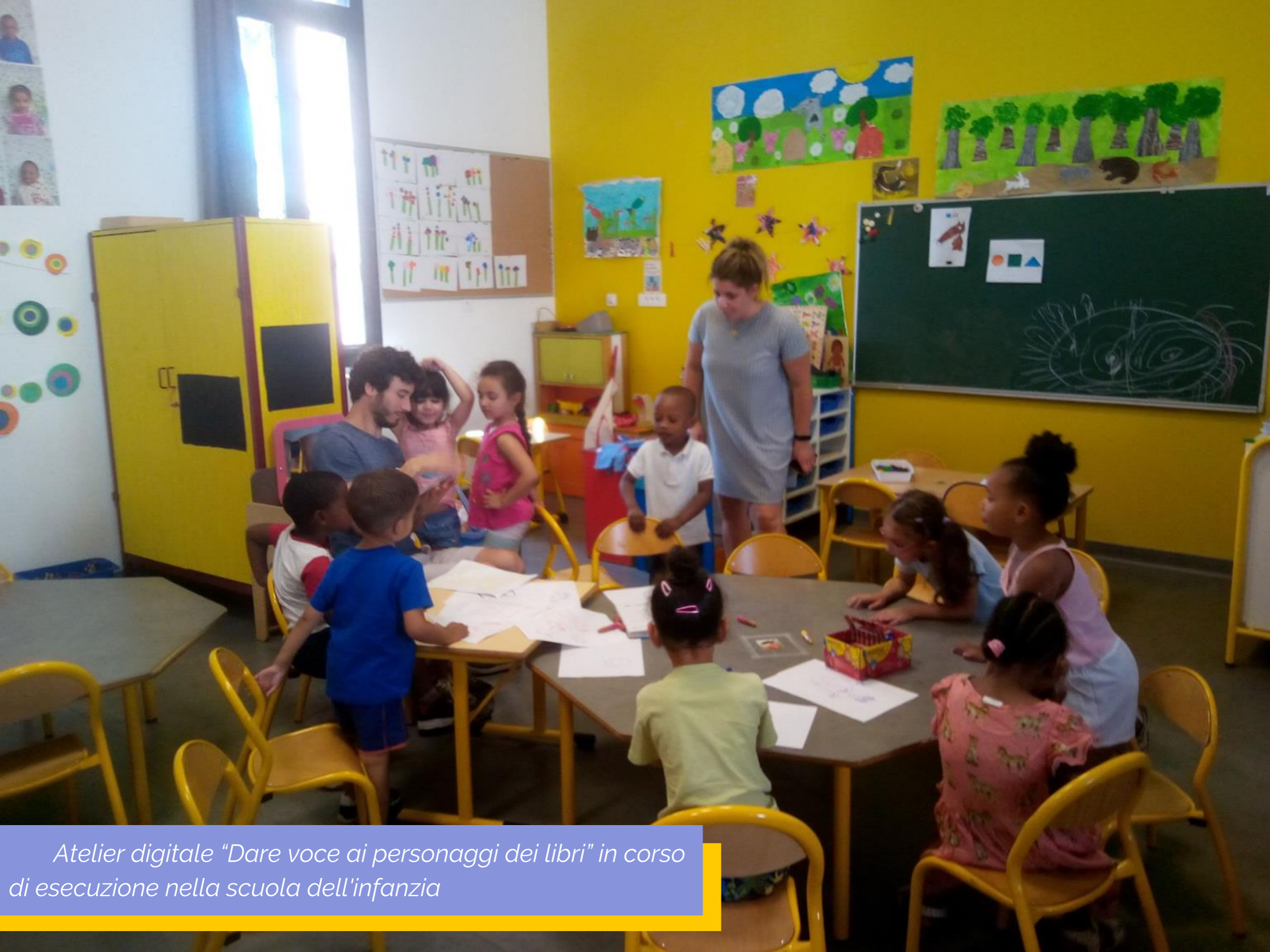
Atelier digitale "Dare voce ai personaggi dei libri" in corso di esecuzione nella scuola dell'infanzia