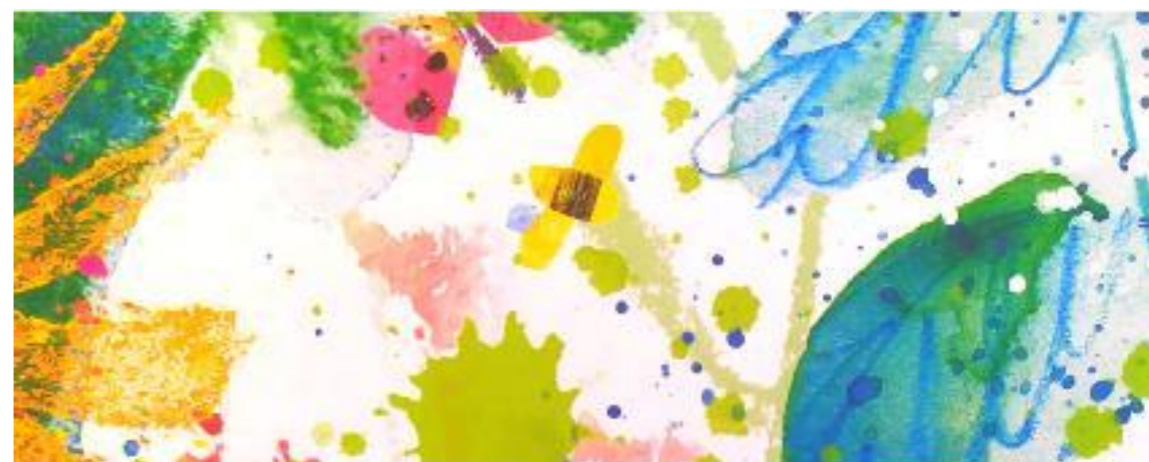
IL NOSTRO GIARDINO STRAORDINARIO