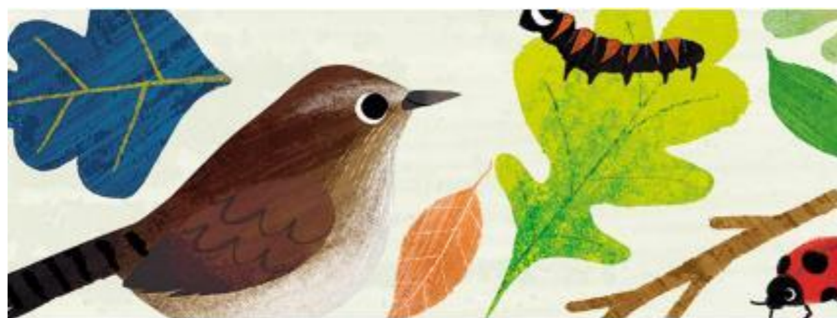
GLI ESPLORATORI DELLA SEZIONE ARIA 🔍