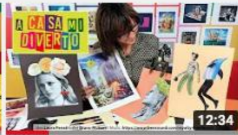
A casa con Zizi - Collage fotografico