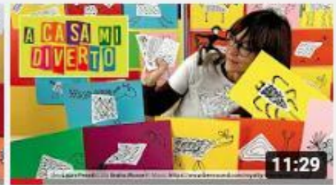
A casa con Zizi - Strappa e Crea