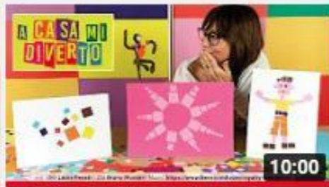
A casa con Zizi - Mosaico