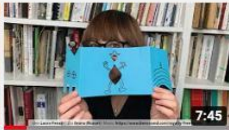
A casa con Zizi - Libro a soffietto