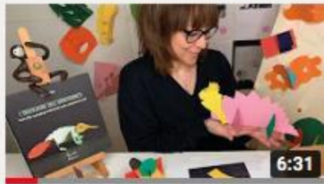
A casa con Zizi - Taglio Incastro Creo