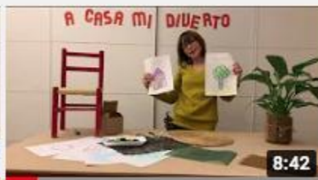
A casa con Zizi - Sfrega e colora