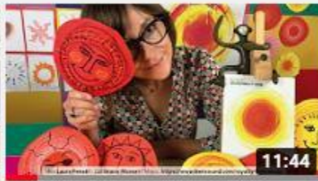
A casa con Zizi - Disegnare il sole