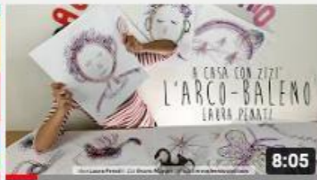
A casa con Zizi - Arcobaleno... in un...