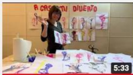
A casa con Zizi - Un filo di colore.