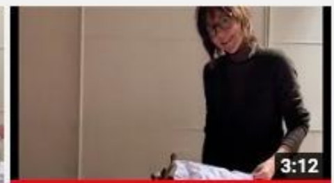
A casa con Zizi il lettino

Link al canale di Youtube di Laura Penati: