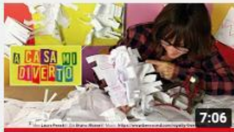
A casa con Zizi - Libro Bianco senza parole