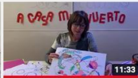
A casa con Zizi - Scarabocchiando.....