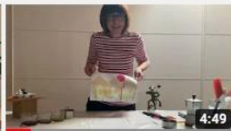
A casa con Zizi color barbabetola