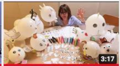
A casa con Zizi - gonfiAnimali