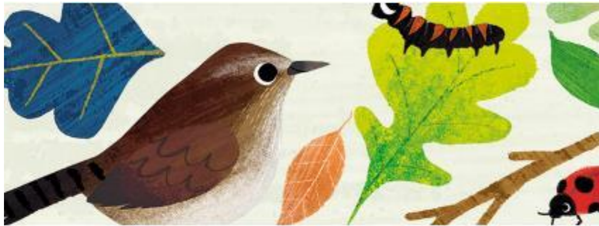
GLI ESPLORATORI DELLA SEZIONE ARIA 🔍

construção de um "KIT explorador" na escola, que acompanhava as crianças em casa, para depois ser transferido para a escola