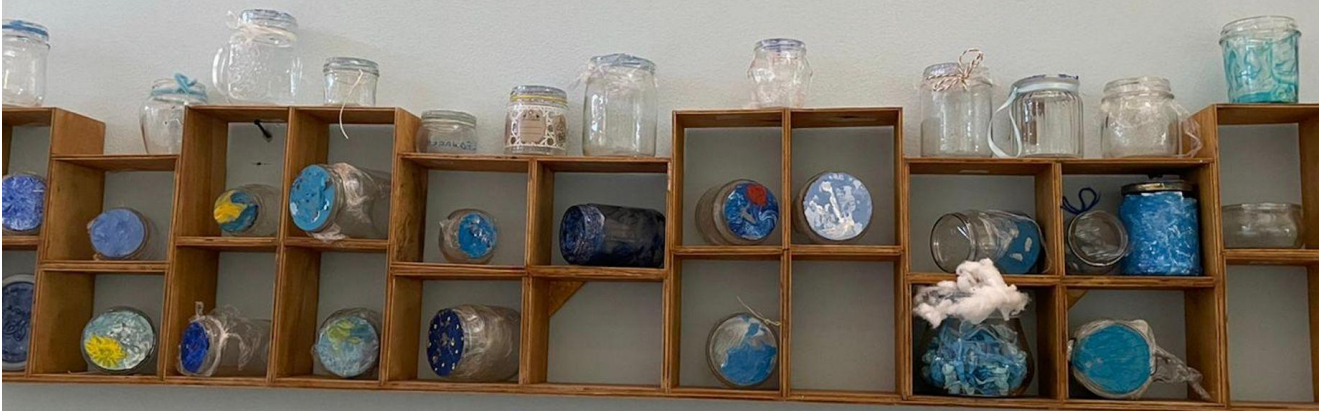
Il cielo di casa in barattolo